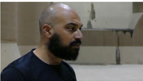
מתוך עבודת הווידיאו "לווייתן"

יונה יצא מנמל יפו למסעו באוניה שנקלעה לסערה וממנה הושלך, לפי עצתו. לשם, ליפו, חזר סגל בווידיאו "הקבר" שצולם בחפירה ארכאולוגית בעיר. כשמדובר בחפירות ביפו, אחת הערים העתיקות בעולם, אין רגע דל, דתית ולאומית. טוב עשה סגל בהקרינה שמרצדת על קיר הבנים הישן של המבנה שלא טבל במדמנה הפוליטית, כמו גם באנלוגיה של הובס על הלווייתן כריבון האבסולוטי. סגל נשאר על הציר שבין הבבאי-תנ"כי לבין הרמנטי-מלווילי, כשהדמיו שלו זועק ממעמקים מדיק ועמום במידה. ממילא הוא לא בא להניף כרה בעד או ננד החפירות, אלא להדגיש כשמשופרים, בוקעים קולות מן העבר, ולא תמיד הם מתיישבים עם הנרטיב או העמדה שלי.