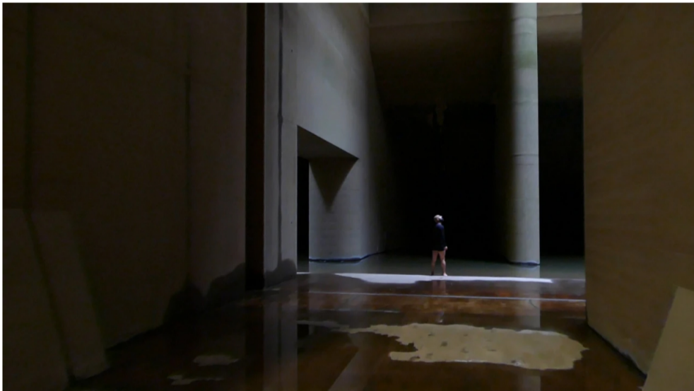
מתוך עבודת הווידיאו "לווייתן"

ביציאה מהתערוכה כמעט פספסתי את העבודה האחרונה. ראיתי כבר מספיק וידיאו HD של טבע שמדמה ציור. ואז, לאט לאט, הערפל התחיל לזוז